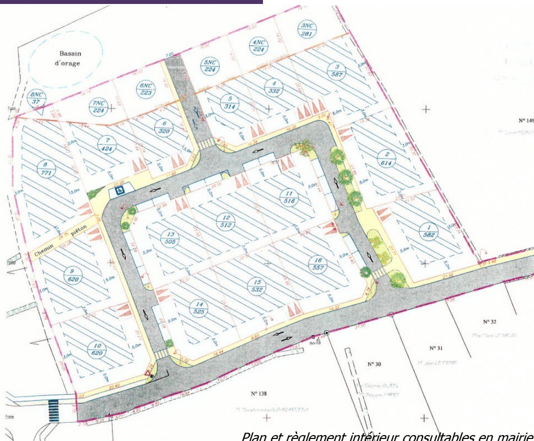
Plan et règlement intérieur consultables en mairie.

Les personnes intéressées peuvent contacter la mairie pour de plus amples renseignements.