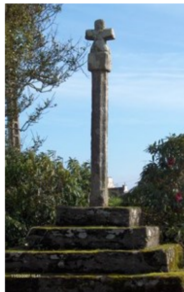
Une des sept croix de Peumerit. Où est celle-ci ?