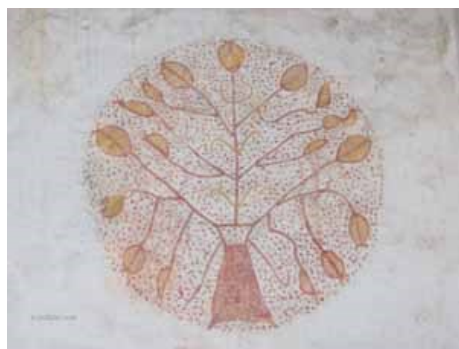
Une très belle fresque... Où est-elle ?

Quizz ! Connait-on bien la commune ? Quelques photos de Peumerit vous permettront de mettre votre coup d'oeil à l'épreuve.