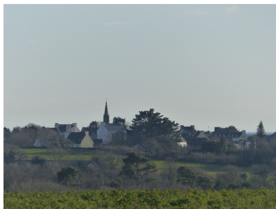
D'où est prise cette photo ?

Un menhir parmi tant d'autres... Près de quel hameau est situé celui-ci ? Un indice : au nord-est de la commune.