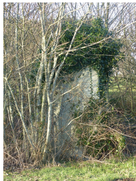
==> Les réponses en avril sur le site internet...

Un menhir parmi tant d'autres... Près de quel hameau est situé celui-ci ? Un indice : au nord-est de la commune.