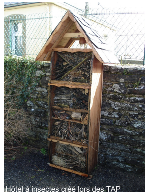
Hôtel à insectes créé lors des TAP

La mise aux normes d'accessibilité, obligatoire, se fera par une mise à niveau du sol de la cour des grands qui viendra à hauteur des marches d'entrée des classes. Elle permettra du même coup de faciliter l'évacuation d'urgence.