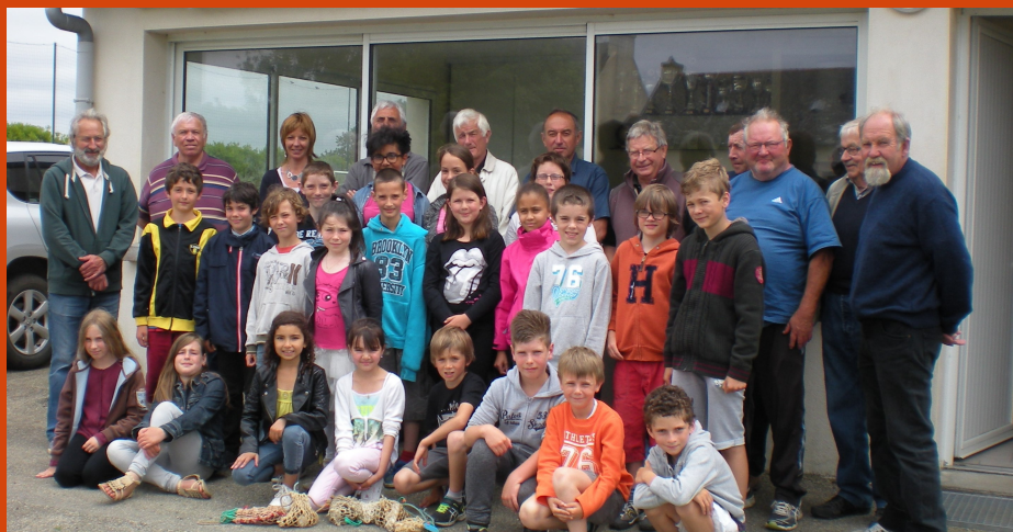
Les CM1 et CM2 galocheurs en herbe et leurs initiateurs - Juin 2015

Au mois de juillet, le challenge J. Le Borgne enchaîne cinq journées de concours, réparties en 2 groupes, pour un classement final individuel. Les jeunes participent également à leur propre challenge P. Le Pape en mai-juin. De mars à octobre viennent s'intercaler, les différents concours et jubilés organisés. Une quarantaine en tout.