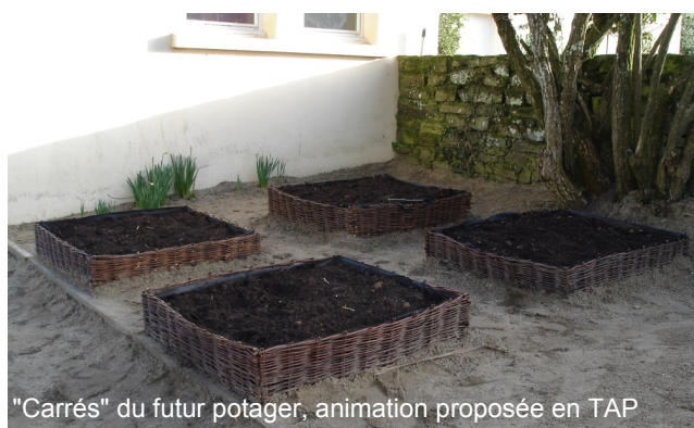
"Carrés" du futur potager, animation proposée en TAP

La circulation des véhicules sur le parking aux horaires d'entrée et sortie de classe pose encore soucis : les marches arrière, les arrêts devant le portail obligeant les piétons à contourner les véhicules, etc., sont autant de mises en danger des enfants . Pour une meilleure gestion de l'espace, veillons à stationner dans le même sens, face à l'école et sur deux « lignes » pour que chaque famille puisse se garer et repartir facilement. Parents, grands-parents, merci de votre vigilance !