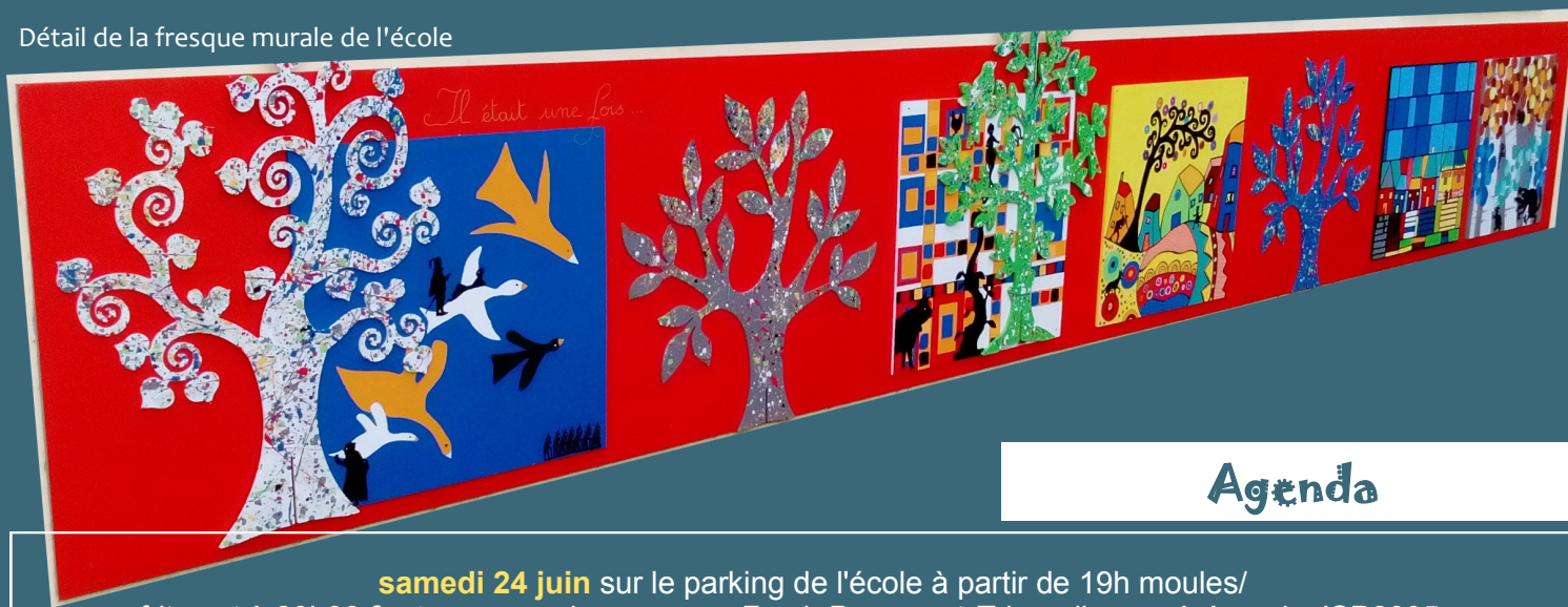
Détail de la fresque murale de l'école

L'appel aux volontaires désirant rejoindre le comité comme membres ou bénévoles est d'ores et déjà lancé ! Merci de contacter la mairie.