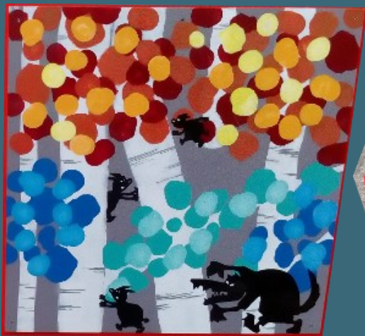
Détails de la fresque murale de l'école