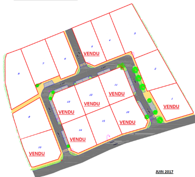
LOTISSEMENT DE PARC GEOT

N'hésitez pas à promouvoir ces terrains !