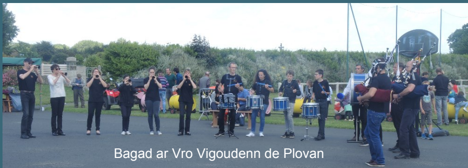
Bagad ar Vro Vigoudenn de Plovan

De plus amples renseignements seront donnés dans le dossier de rentrée .