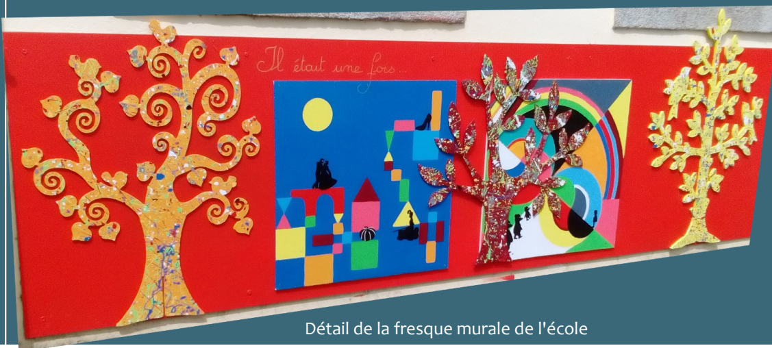
Détail de la fresque murale de l'école