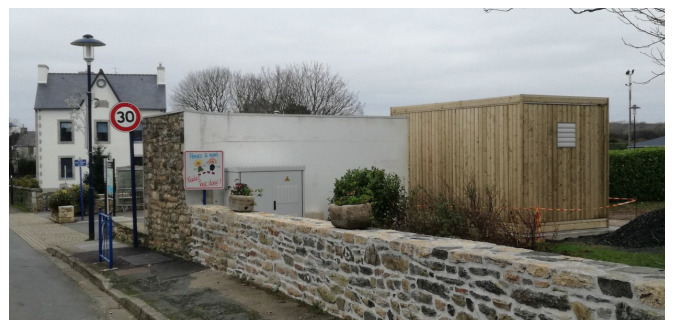
L'installation du Shelter a été réalisée en décembre

Le "Shelter" est la plaque de distribution de la fibre optique vers la commune et les communes avoisinantes