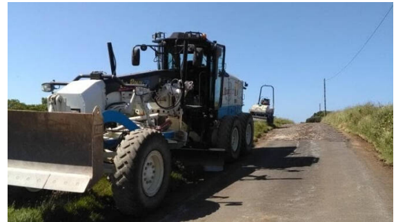
Réfection de la voie d'accès à Parc Gallo par l'entreprise Le Roux.

La délibération complète sur le transfert de compétence est disponible sur le site Internet de la commune : conseil municipal du 19 décembre 2019.