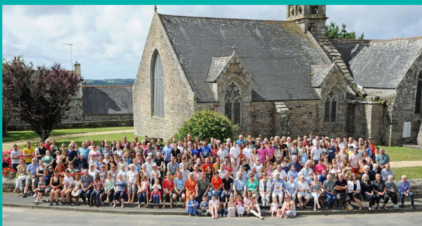
250 PEUMERITTOIS RASSEMBLÉS POUR LA PHOTO DU QUART DE SIÈCLE